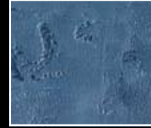
Oceano - Ocean Blue MF01 + HM05 + MO23