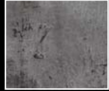
Grafite - Black Graphite MF01 + HM01 + MO23