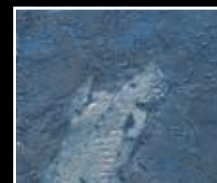
Oceano - Ocean Blue MF01 + HM05 + MO23