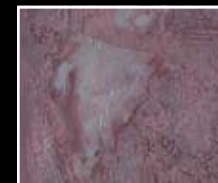
Vino - Red Wine MF01 + HM07 + MO23