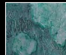
Bosco - Forest Green MF01 + HM06 + MO23