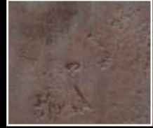
Ruggine - Rust Red MF01 + HM02 + MO23