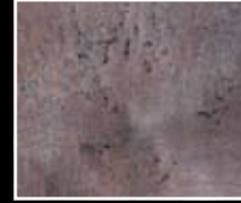
Tempesta - Violet Storm MF01 + HM04 + MO23