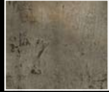
Fango - Mud Green MF01 + HM03 + MO23