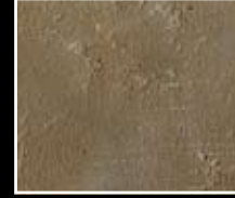
Ocra - Yellow Ochre MF01 + HM08 + MO23