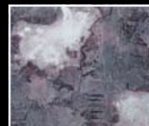
Tempesta - Violet Storm MF01 + HM04 + MO23