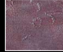
Vino - Red Wine MF01 + HM07 + MO23