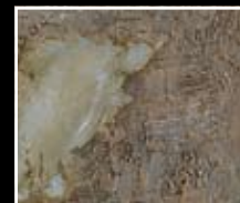
Ocra - Yellow Ochre MF01 + HM08 + MO23