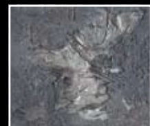
Grafite - Black Graphite MF01 + HM01 + MO23