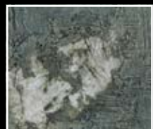
Fango - Mud Green MF01 + HM03 + MO23