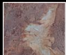
Ruggine - Rust Red MF01 + HM02 + MO23